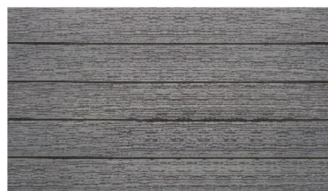
Hellgrau massiv gebürstet