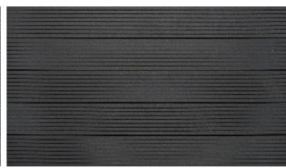
Dunkelgrau massiv genutet