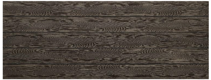
Thermoesche (Optik) struktur