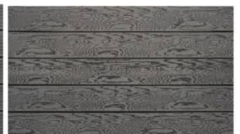
Hellgrau massiv struktur