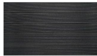
Dunkelgrau massiv gerillt