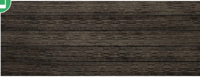
Thermoesche (Optik) gebürstet