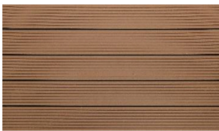
Hellbraun massiv genutet