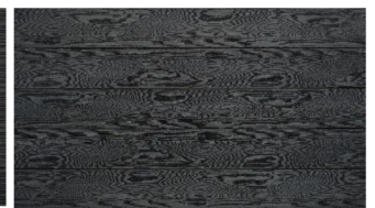
Dunkelgrau massiv struktur

Das Naturprodukt Holz ist einzigartig in seiner Form und Beschaffenheit. Struktur- und Farbunterschiede unterstreichen seine Individualität und stellen keinen Mangel dar. Mit unserer langjährigen Erfahrung und der Liebe zum Holz sind wir stets bestrebt Ihnen ein einwandfreies Produkt zu liefern. Gänzlich können wir vereinzelte Sortier- und Produktionsfehler nicht ausschließen, welche jedoch 5% der Liefermenge nicht überschreiten.