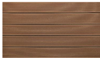
Hellbraun massiv gerillt