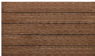
Hellbraun massiv gebürstet