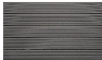
Hellgrau massiv gerillt