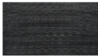
Dunkelgrau massiv gebürstet