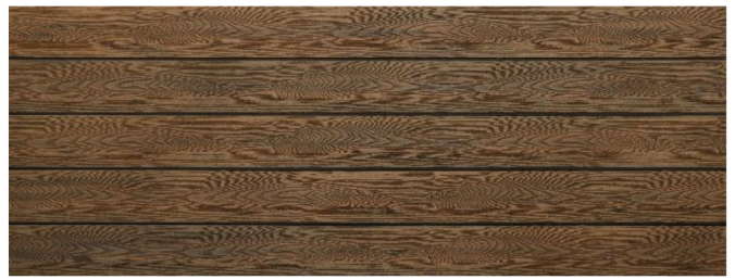
Thermoeiche (Optik) struktur