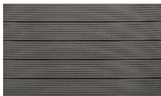
Hellgrau massiv genutet