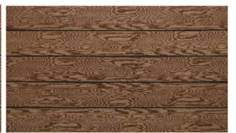
Hellbraun massiv struktur