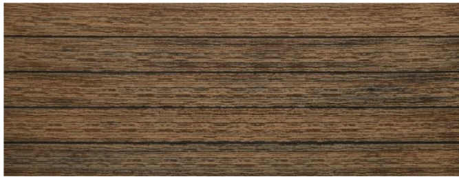
Thermoeiche (Optik) gebürstet